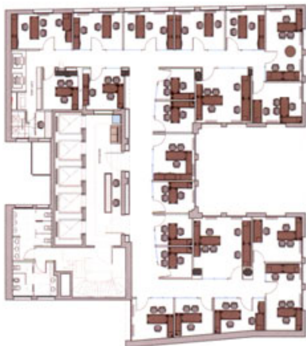
Planta piso 14°