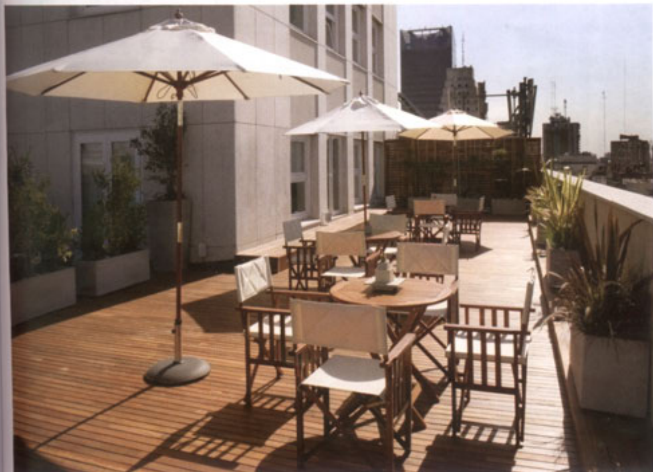
Vista de la terraza de uso exclusivo en 15º piso.