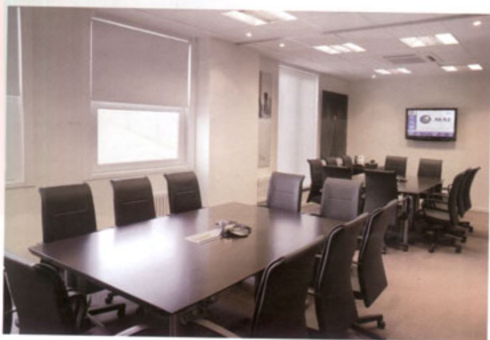
Salas de reuniones en 15° piso que cuentan con la posibilidad de unirse y aumentar su capacidad hasta 18 personas.