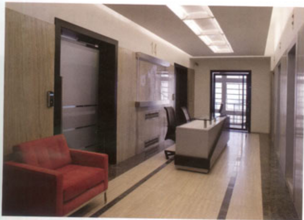
Recepción piso 14°. Los sillones tapizados en chenille naranja son un diseño clásico de Florence Knoll.