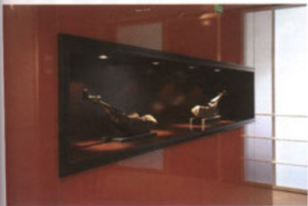
Espacios preparados para la exposición de objetos de arte en el área de circulación del 14º piso