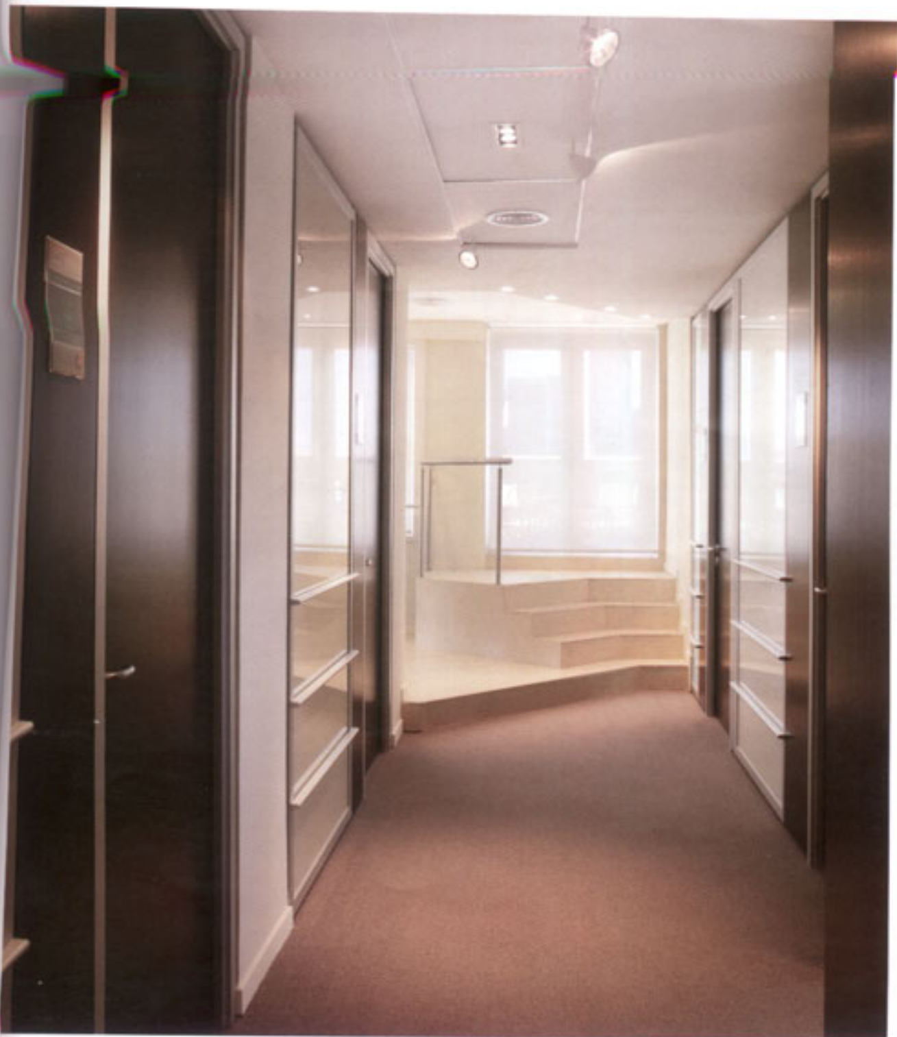
Vista de la circulación en 15º piso. Al fondo, acceso a la terraza y la cafetería.